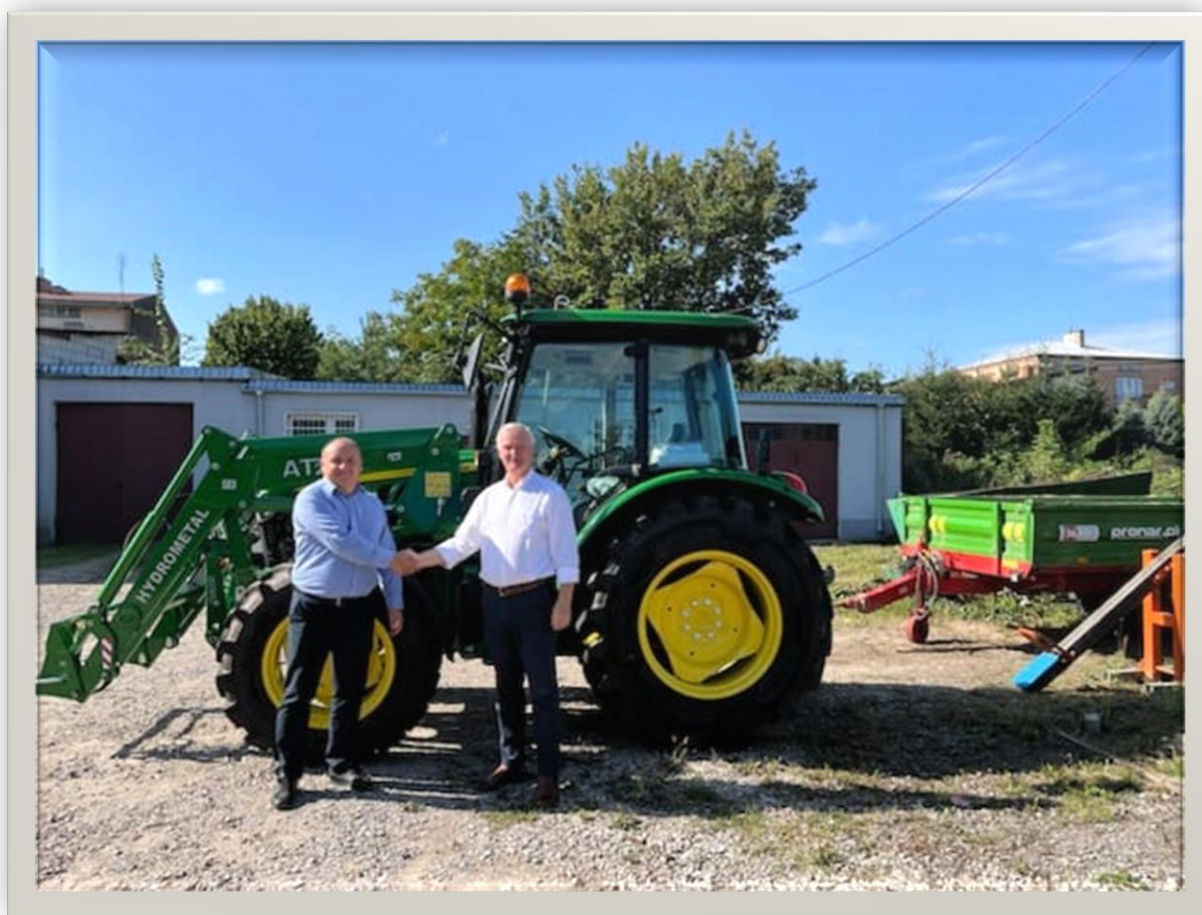
Ciągnik rolniczy o wartości 322 380,00