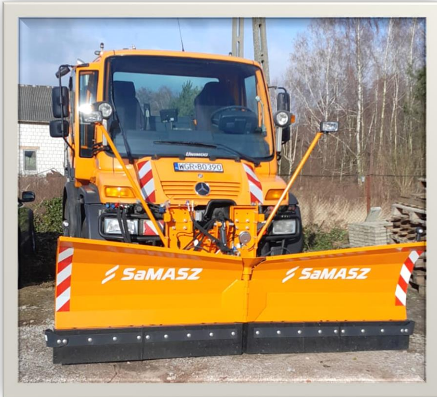
Samochód specjalny Unimog z pługiem o wartości 310 557,00zł.