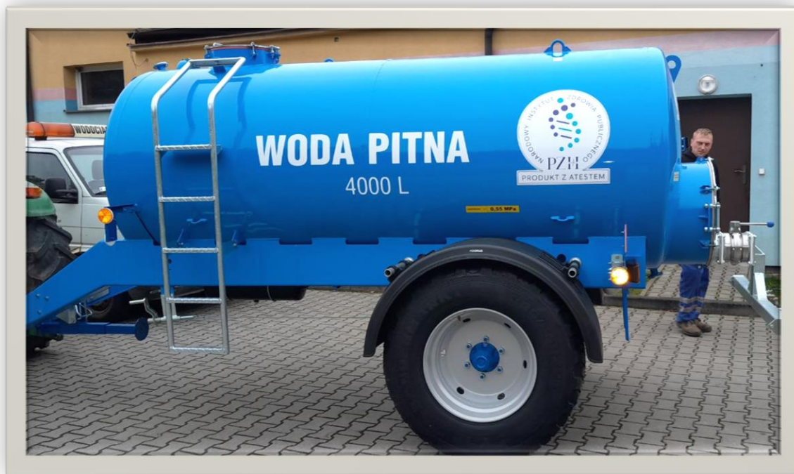
Wóz do wody pitnej o wartości 39 112,00zł.