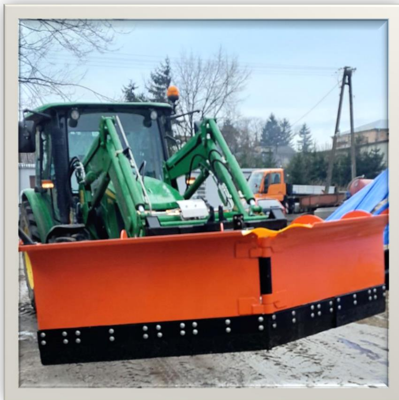
Pług śnieżny o wartości 18 204,00