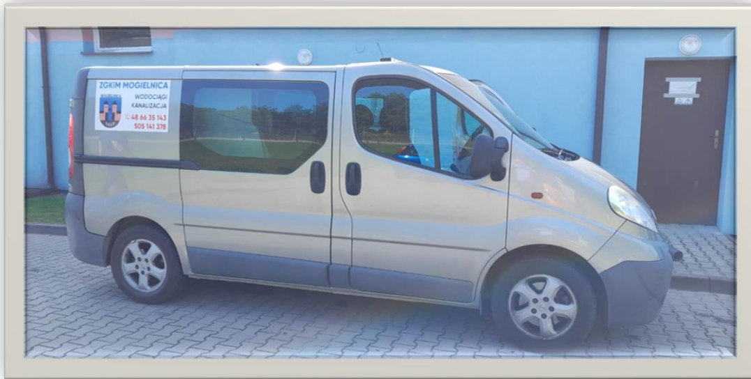
Opel Vivaro o wartości 36 160,00