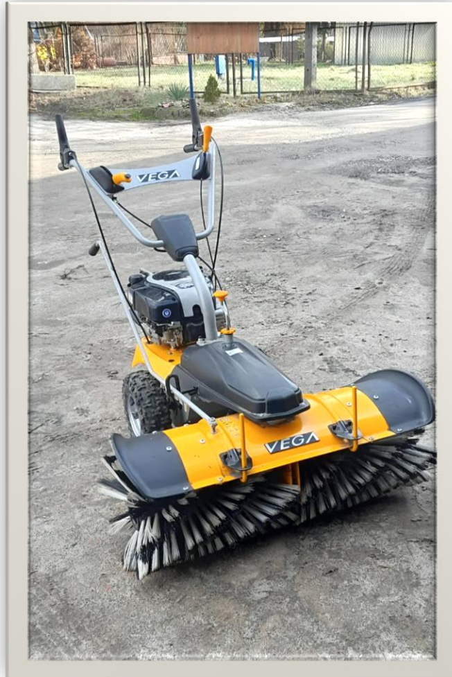
Zamiatarka o wartości 4200,00 zł