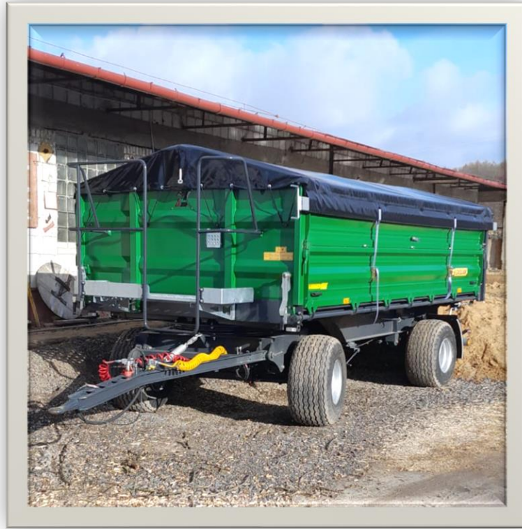
Przyczepa rolnicza o wartości 88 680,00zł.