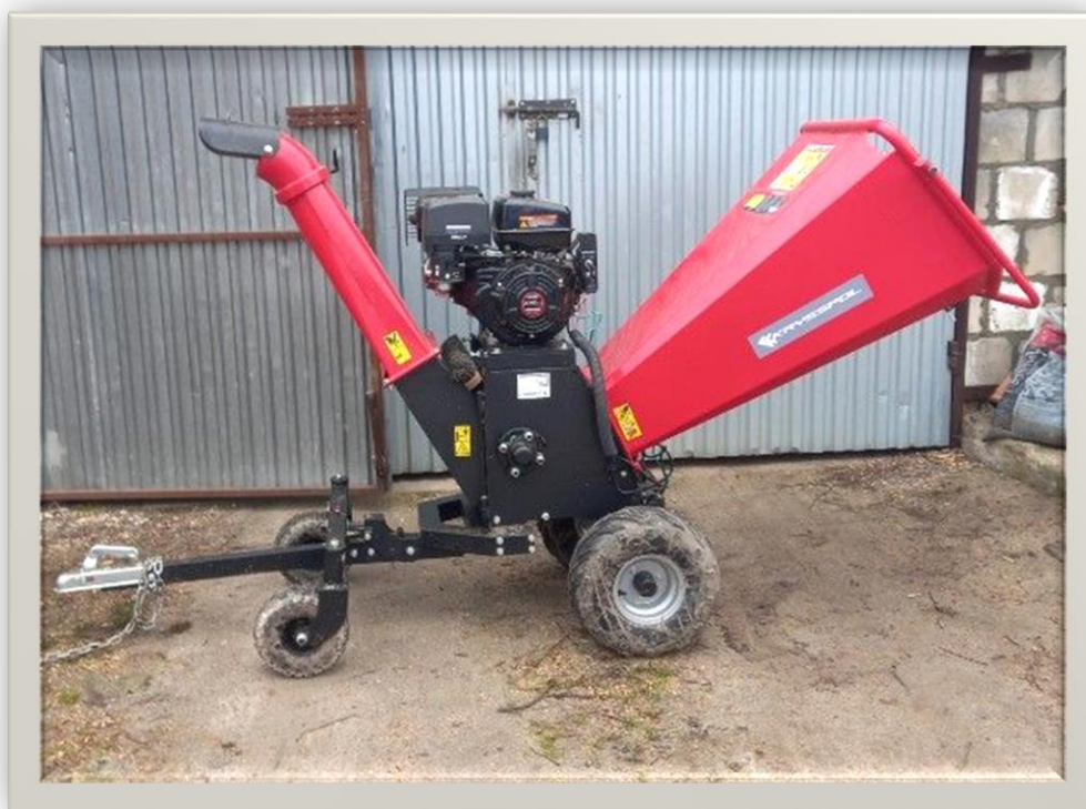
Rębak o wartości 5900,00