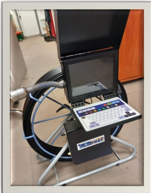
Kamera inspekcyjna o wartości 19 344,39zł.