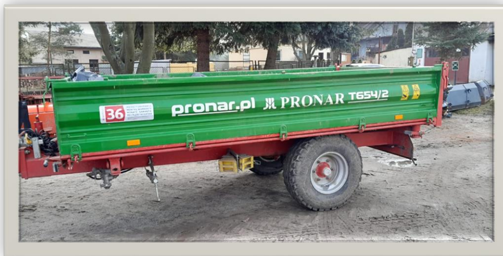
Przyczepa o wartości 36 000,00zł. zakupiona w 2022r